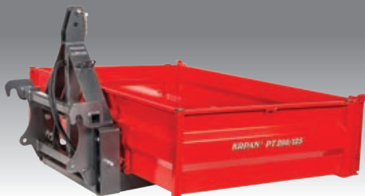
PT mit EURO Adapter