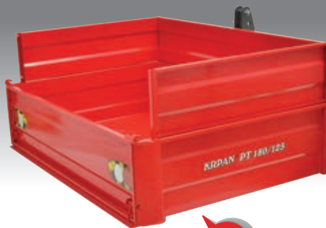
PT mit Aufsatzwänden